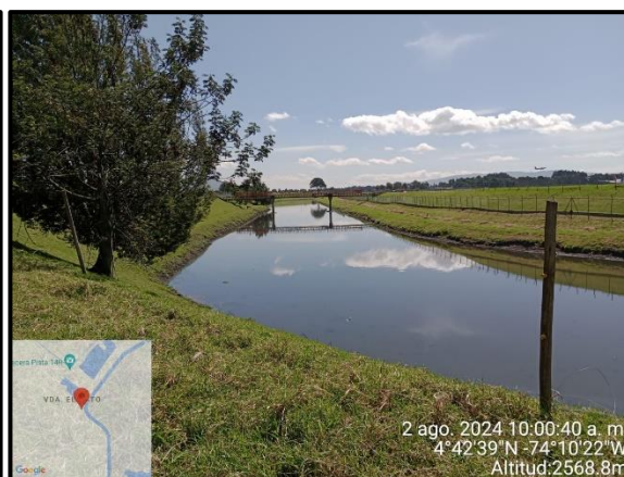
Ilustración 5. Evidencia recorrido, punto 4.