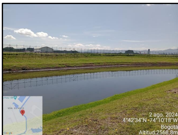
Ilustración 4. Evidencia recorrido, punto 3.