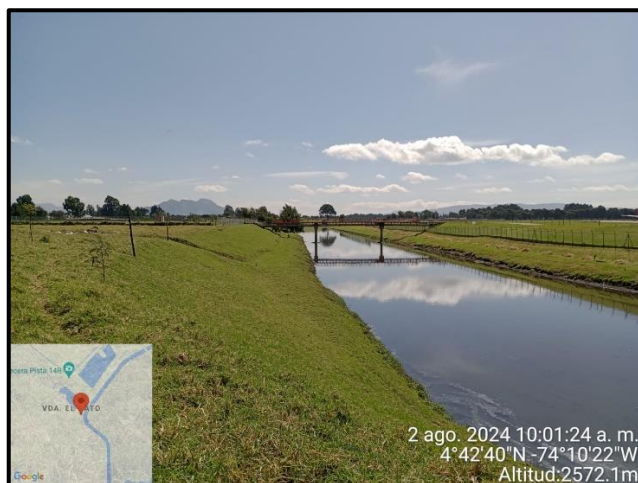
Ilustración 6. Evidencia recorrido, punto 5.

C.P. 250020 Tel. +57(1) 823 40 70 823 40 71 / 823 40 73 Fax. + 57(1) 825 76 20 Dir. Cra. 14 No. 13-05