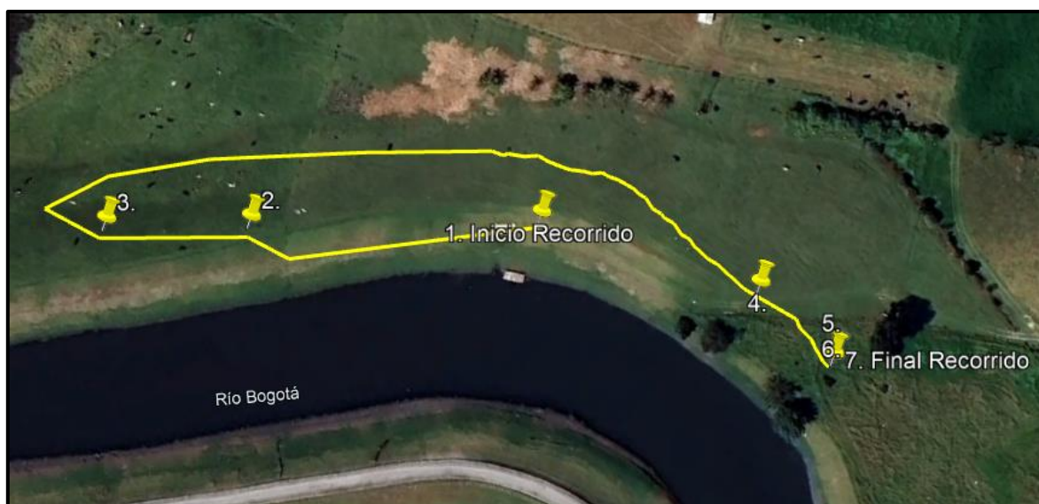
Ilustración 1. Recorrido verificación ambiental ronda Río Bogotá - Vereda La Florida.

Considerando que el Río Bogotá fue catalogado como un ecosistema de vital importancia para su preservación y recuperación, el día 02 de agosto de 2024, se realizó recorrido de control y vigilancia en la ronda hídrica del río Bogotá desde las coordenadas 4°42'39"N - 74°10'21"W hasta las coordenadas 4°42'40"N - 74°10'22"W (ilustración 1, Ruta amarilla), con el fin de verificar las condiciones ambientales, identificar posibles afectaciones a los recursos naturales y realizar las acciones de prevención correspondientes.