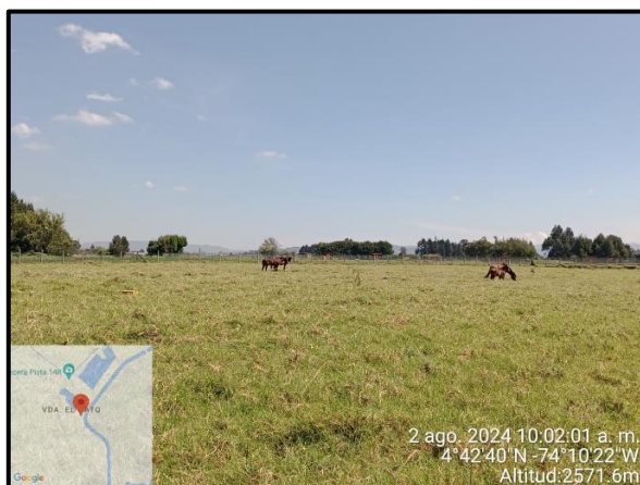
Ilustración 7. Presencia de semovientes, punto 6.